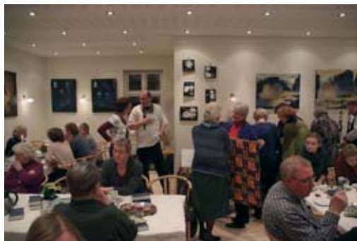
Højskolesangbogen er med ved enhver lejlighed.